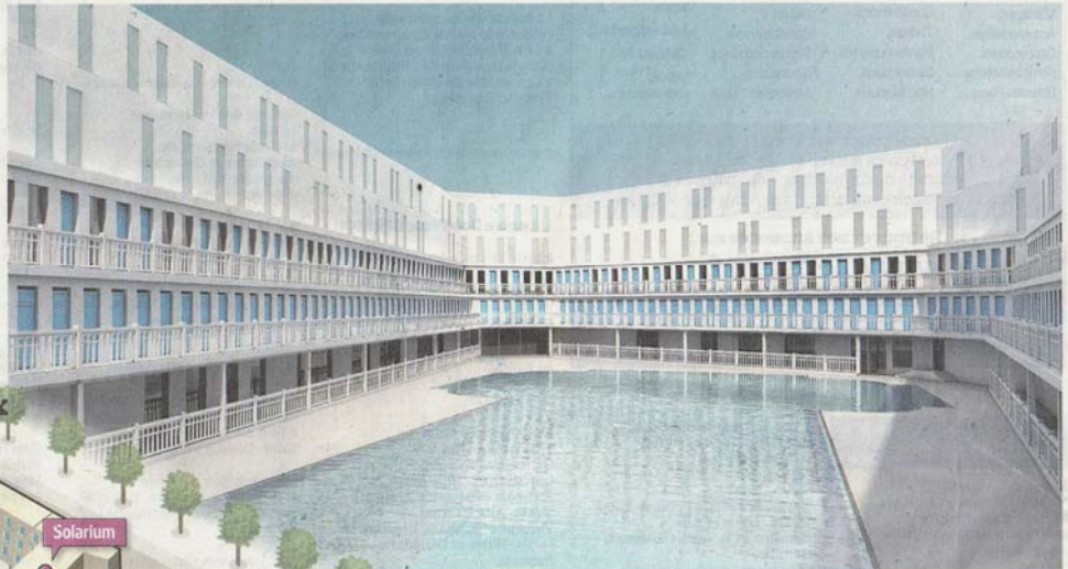
Vue d'artiste du bassin d'été avec la façade de l'hôtel. Ci-dessous, la piscine publique couverte. A. DERBESSE ARCHITECTES

Laissé en friche durant 22 ans, ce lieu mythique va rouvrir en 2014. Il abritera une piscine publique et un hôtel 4 étoiles autour du bassin d'été.