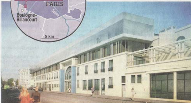
Vue d'artiste de l'entrée du centre de thalasso-fitness, avenue de la Porte-Molitor. A. DERBESSE ARCHITECTES